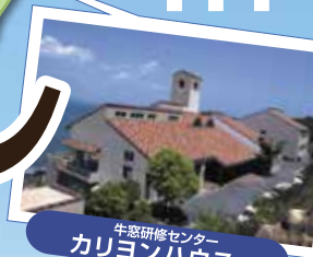
牛窓研修センター カリヨンハウス