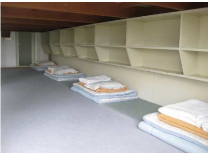
大部屋 利用人数制限