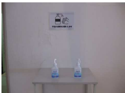
館内外各所への消毒液の設置