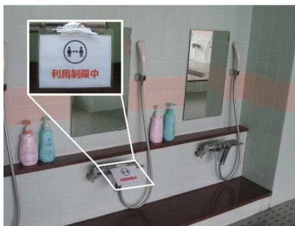
浴場 カラン数制限