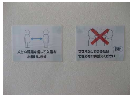
脱衣場 コロナ対策掲示