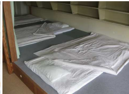
大部屋 利用イメージ