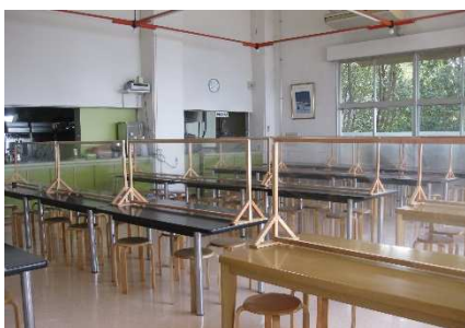
飛沫感染防止パーテーション

食堂は収容人数を減らし（1テーブル6人掛 → 4人掛）、飛沫感染防止パーテーションを各テーブルに設置しています。食堂以外にも研修室での分散利用が可能です。