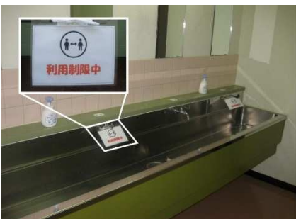
洗面台 カラン数制限

共用の脱衣場・浴場内では感染対策に関する掲示を行い、カランや脱衣カゴの数を従来の半数程度に減らし利用人数を制限しております。