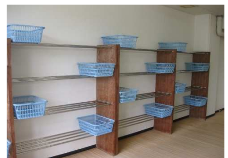
脱衣場 脱衣カゴ数制限