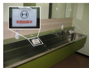
洗面台 カラン数制限