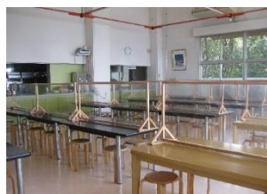
パーテーション：食堂

食事の個人盛提供、従業員による取り分け、もしくは個別のお客様専用トング及びお箸や使い捨て手袋等を用意し、共用を避けるなどの措置を実施しています。お食事後のテーブル・椅子はその都度、清掃及び消毒を行っております。食事中のお客様には大声の会話、飲食時の回し飲み等にご遠慮いただいております。