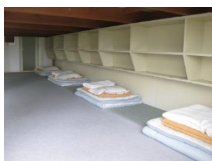
大部屋 利用人数制限

共用の脱衣場・浴場内では感染対策に関する掲示を行い、カランや脱衣カゴの数を従来の半数程度に減らし利用人数を制限しております。