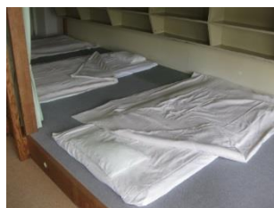
大部屋 利用イメージ