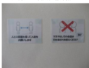
脱衣場 コロナ対策掲示