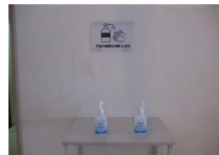
館内外各所への消毒液の設置