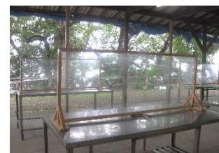
野外炊飯場（パンプキン広場）