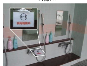
浴場 カラン数制限