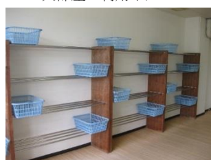
脱衣場 脱衣カゴ数制限